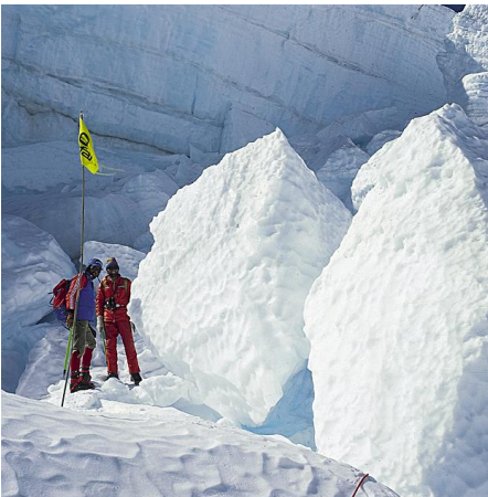
Khumbu Eisbruch

1978 leitete Wolfgang Nairz die erste österreichische Mount Everest Expedition .